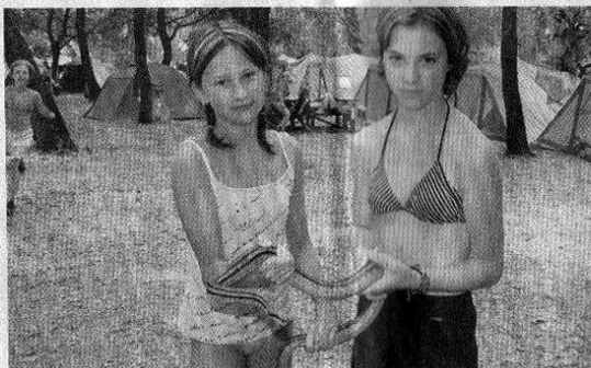
S HADEM. Děti na přírodovědném táboře v Řecku mají možnost zkoumat zajímavé živočichy.

„Nejdřív místo sloužilo jen nadšencům. Pak s námi začali jezdit od-